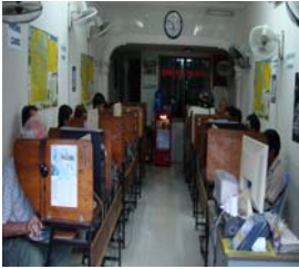
ហាងអ៊ីនធឺណែតមួយក្នុងទីក្រុងភ្នំពេញដែលមានអតិថិជនជាប្រចាំ

ខណៈពេលសរសេររបាយការណ៍នេះនៅឆ្នាំ២០០៩ ប្រទេសកម្ពុជាជាប្រទេសចុងក្រោយគេ ដែលជួបប្រទះនឹងការហាមមិនឲ្យមានការវិះគន់លើអ៊ីនធឺណែតដែលកើតឡើងទូទាំងទ្វីបអាស៊ី។ ការរីកចម្រើនយ៉ាងលឿនរបស់អ៊ីនធឺណែតនៅតំបន់អាស៊ីចាប់តាំងពីឆ្នាំ២០០០មក បង្ហាញថាអ៊ីនធឺណែតជាឧបករណ៍សំរាប់អ្នកជំទាស់ប្រឆាំងរដ្ឋាភិបាល និង បាតុករដើម្បីចែកចាយព័ត៌មាន ដូចជានៅប្រទេសចិន ភូមា ថៃ វៀតណាម និង ម៉ាឡេស៊ី ។ មជ្ឈមណ្ឌលកម្ពុជាដើម្បីប្រព័ន្ធផ្សព្វផ្សាយឯករាជ្យ ពិតជាមានការព្រួយបារម្ភក្រោយពេលក្រសួងព័ត៌មានបានបញ្ជាឲ្យបិទវិបសាយ reahu.net ដែលជាវិបសាយបង្ហាញរូបរាងអប្សរក្នុងរាងកាយអាក្រាត។ ការបញ្ជាឲ្យបិទនេះកើតឡើង បើទោះបីជាអត្រាប្រើប្រាស់អ៊ីនធឺណែតទាបស្មើនឹង ០,៤៨ ភាគរយ ឬ ៧០,០០០ក្នុងចំណោម១៤លាននាក់។ សរុបមកវាបង្ហាញថារូបភាពអប្សរទាំងនេះនឹងមិនទៅដល់ទស្សនិកជនអោយបានទូលំទូលាយឡើយ។ អត្រាប្រើប្រាស់អ៊ីនធឺណែតរបស់ប្រទេសកម្ពុជាទាបជាងគេនៅក្នុងតំបន់អាស៊ី ។ ហើយ ការបញ្ជាអោយបិទវិបសាយអាសអាភាសនេះ ពិតជាអាចជះឥទ្ធិពលដល់រឿងនយោបាយ ។