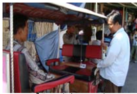
អ្នកតម្កល់កងប៊ីនៅក្នុងទីក្រុងភ្នំពេញកំពុងស្តាប់ព័ត៌មានតាមវិទ្យុ

កាសែតប្រឈមមុខនឹងការរិះគន់កំរិតខ្ពស់ជាងគេ បើតាមការសម្ភាសទាំងឡាយនេះមកពីមានប្រជាជនកម្ពុជាដែលអាចអានបានចាប់អារម្មណ៍អានជាមួយនឹងការយកចិត្តទុកដាក់ខ្ពស់ទៅលើរឿងនយោបាយដែលជំរុញអោយព័ត៌មាននៅក្នុងកាសែត ទំនងជាមានព័ត៌មាននយោបាយក្តៅគគុក។