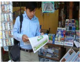
បុរសម្នាក់នេះកំពុងស្វែងរកព័ត៌មានតាមតុបកាសែតក្នុងទីក្រុងភ្នំពេញ

ក្នុងចំណោមប្រព័ន្ធផ្សព្វផ្សាយដូចជាកាសែត ទស្សនាវដ្តី វិទ្យុ ទូរទស្សន៍ និង អ៊ិនធឺណែត អ្នកឆ្លើយតបភាគច្រើនចាត់ទុកថាវិទ្យុមានសេរីភាពខ្លាំងបំផុតជាមួយនឹងស្ថានីយ៍វិទ្យុដូចជា វិទ្យុអាស៊ីសេរី វិទ្យុសំឡេងប្រជាធិបតេយ្យ និងវិទ្យុសំលេងសហរដ្ឋអាមេរិកដែលផ្សព្វផ្សាយព័ត៌មានរិះគន់រាជរដ្ឋាភិបាល។