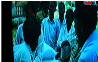
ជាទូទៅទូរទស្សន៍តែងតែចាក់ផ្សាយព័ត៌មានកម្មវិធីចែកអំណោយជូនប្រជាពលរដ្ឋពីសំណាក់មន្ត្រីរដ្ឋាភិបាល

ក្នុងចំណោមប្រព័ន្ធផ្សព្វផ្សាយទាំងឡាយ វិទ្យុ និងទូរទស្សន៍ជាជម្រើសរបស់ប្រជាជនកម្ពុជា។ ក្នុងចំណោមអ្នកឆ្លើយសំណួរ ២០០០នាក់ ដែលធ្វើការស្ទង់មតិដោយអង្គការអន្តរជាតិ IRI នៅឆ្នាំ ២០០៨ មាន៥១% បានអះអាងថាវិទ្យុជាប្រភពចម្បងនៃព័ត៌មាន ហើយ៣៧% បាននិយាយថា ទូរទស្សន៍ មានតែ១% ប៉ុណ្ណោះបាននិយាយថាកាសែត ហើយ ០,២% បាននិយាយថាអ៊ីនធឺណែតជាប្រភពព័ត៌មានសំខាន់។ ប៉ុន្តែសំរាប់កាសែតនិងអ៊ីនធឺណែតភាគច្រើន គឺសម្រាប់ប្រជាជនក្នុងក្រុងដែលធុរការប៉ុណ្ណោះ ។