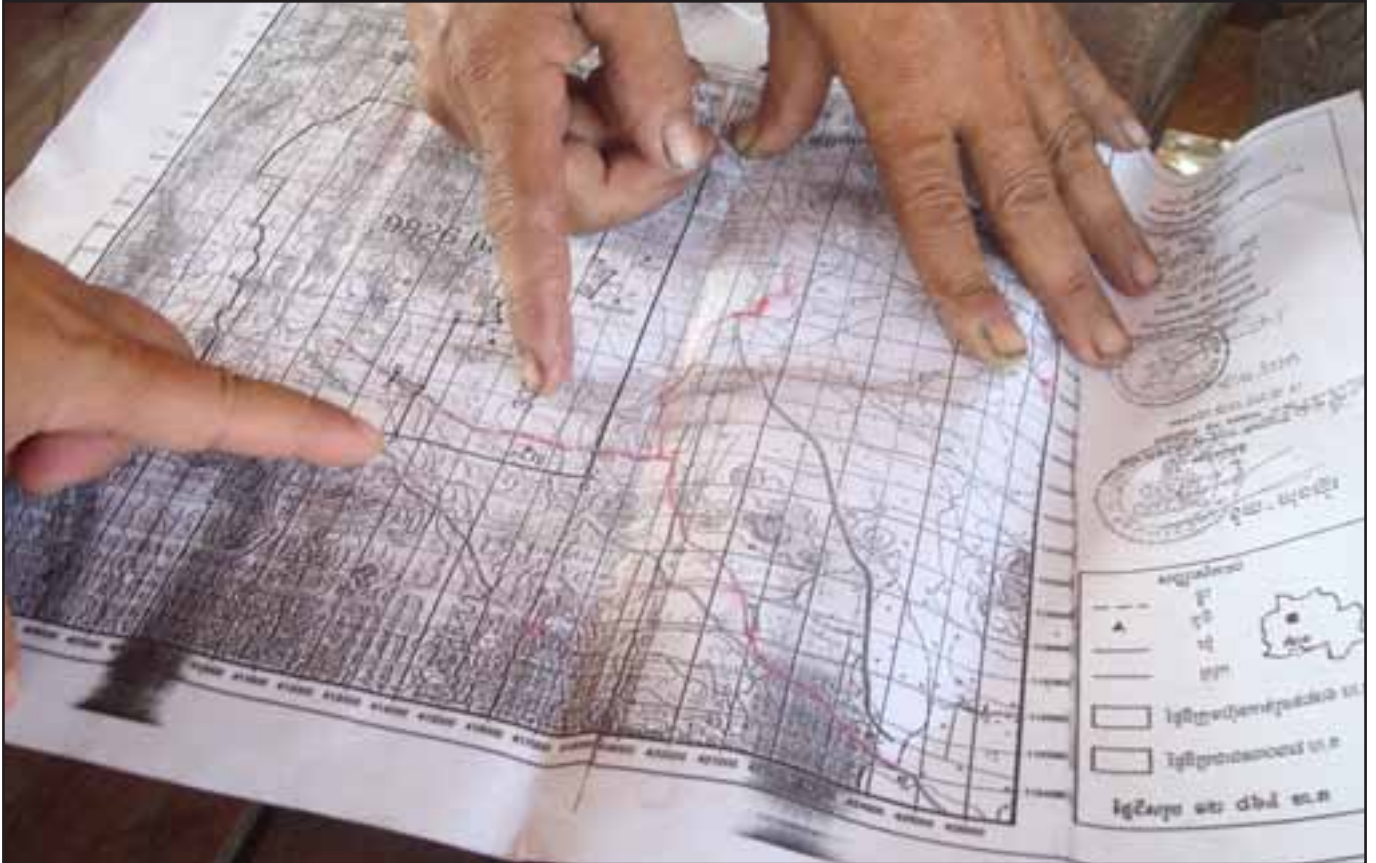
អ្នកភូមិកុំពែសិក្សាផែនទីភូមិសាស្ត្រ ដើម្បីចង្អុលបង្ហាញទីតាំងដីស្រែចំការ របស់ពួកគាត់ដែលបានរុករានដោយម៉ាស៊ីនឈូសដីរបស់ក្រុមហ៊ុន