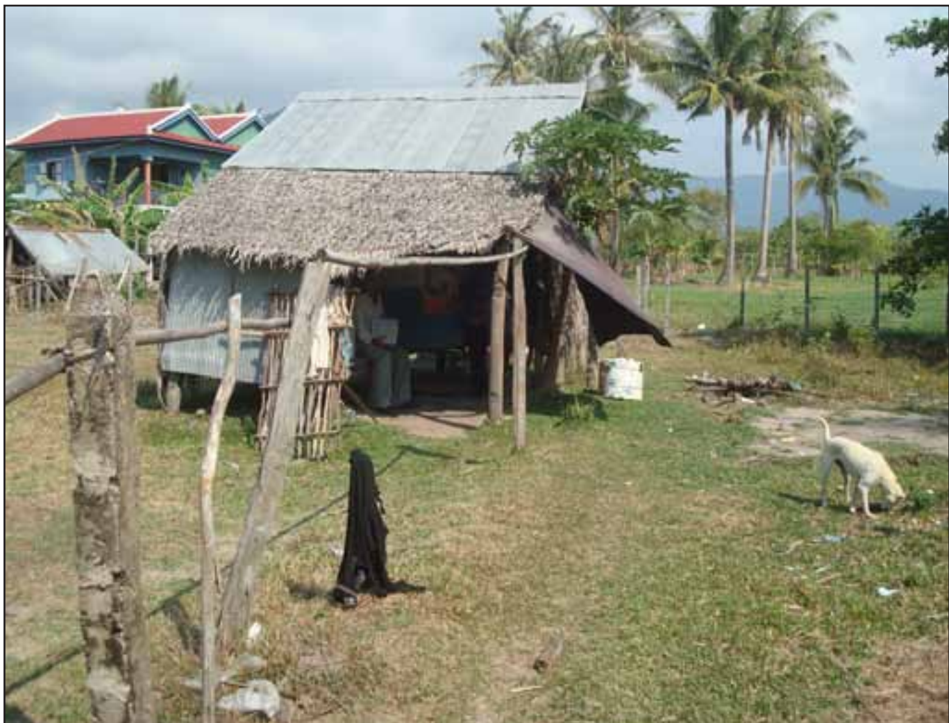
ខ្ញុំសួររបស់អ្នកស្រី ចាន់ ដារ៉ា ឈរ នៅខាងមុខផ្ទះឈើខ្ពស់មួយនៅក្នុងភូមិកែបថ្មី។ ប្រឈមមុខនឹងការបាក់បង់ដែននេសាទ ក្តីសុបិនរបស់អ្នកស្រី ដារ៉ា ក្នុងការសាងសង់ផ្ទះរបស់គាត់ឱ្យបានសមរម្យឡើងវិញ និងត្រូវរលាយដូចផ្សេងៗ

ទទួលបានព័ត៌មានមិនត្រឹមត្រូវពីមន្ត្រីថ្នាក់ក្រោម ” ។