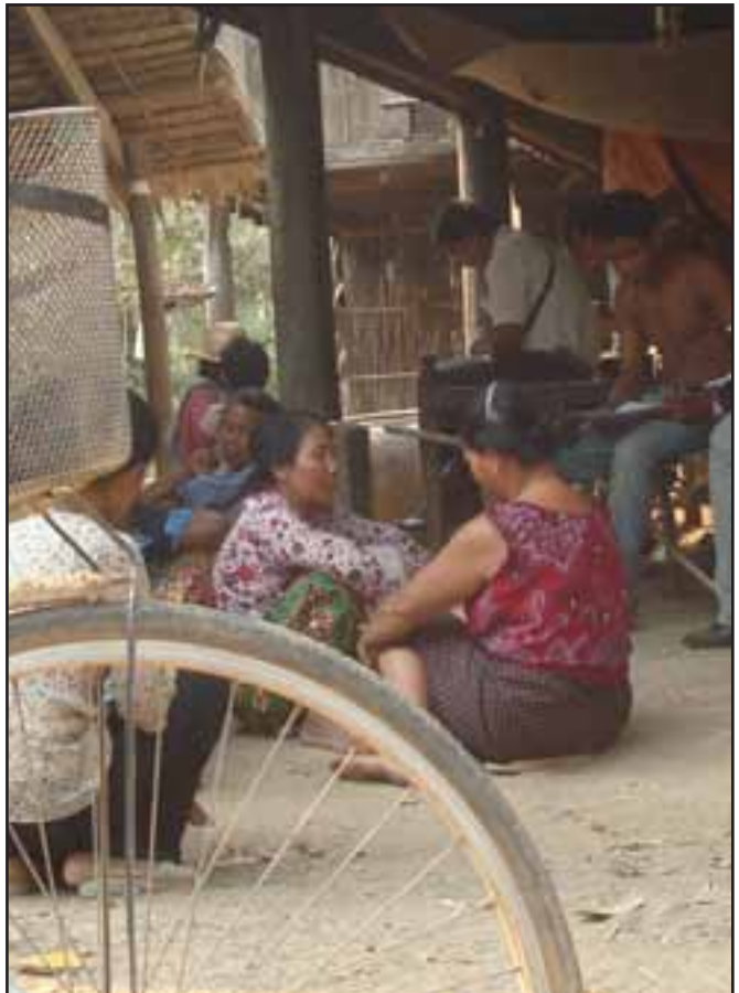
កិច្ចប្រជុំស្តាប់ បានធ្វើឡើងនៅក្រោមផ្ទះរបស់តំណាងសហគមន៍

ក្នុងខែ មីនា ឆ្នាំ ២០០៩ កសិករទាំងឡាយនៅភូមិដីក្រែង បាន