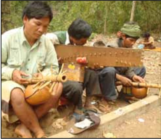
ជនជាតិដើមភាគតិច ៧ នង ដែលជាអ្នកតន្ត្រីករ សុខចិត្តរស់នៅដោយ ប្រកប របរ ជាអ្នកសុំទាននៅឯរមណីយដ្ឋានទឹកធ្លាក់ ប៊ូស្រា ជាដាងលក់កម្លាំងពលកម្ម ទៅស៊ី ឈ្នួលឱ្យក្រុមហ៊ុនដាំកៅស៊ូ។

អស់ ជា ច្រើន សតវត្សរ៍មកហើយ ជនជាតិ ភាគតិច ៧ នង ១ នៅក្នុងតំបន់ ដាច់ស្រយាលនៃខេត្តមណ្ឌលគីរីបាន និងកំពុងរស់នៅចិញ្ចឹម ជីវិតតាមរបៀបតែមួយគត់ ខុសប្លែកពីជនជាតិខ្មែរយ៉ាងច្រើន ដែលរស់ នៅជិតខាងគ្នា ដោយប្រពៃណីកសិកម្មជាចំការវិលដុំ និងជំនឿនានារបស់ ពួកគេ ក្នុងស្មារតីនៃ អ្នកថែរក្សាទឹកដី និងព្រៃព្រឹក្សានានា។