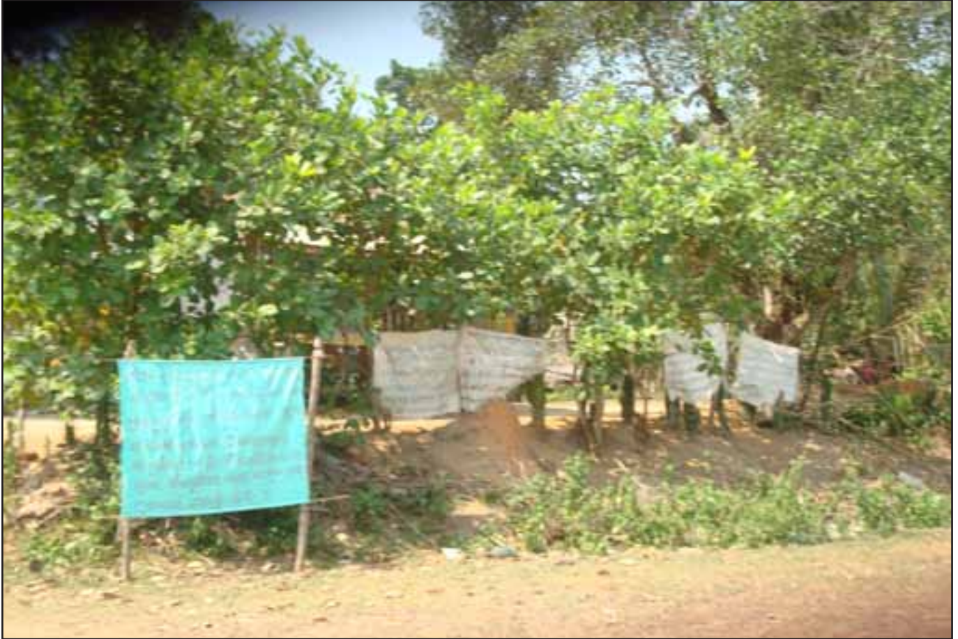
សារត្រូវបានគេសរសេរឡើងនៅលើផ្ទាំងការ៉ុង ដើម្បីស្វែងរកជំនួយពីសម្តេចតេជោហ៊ុនសែន