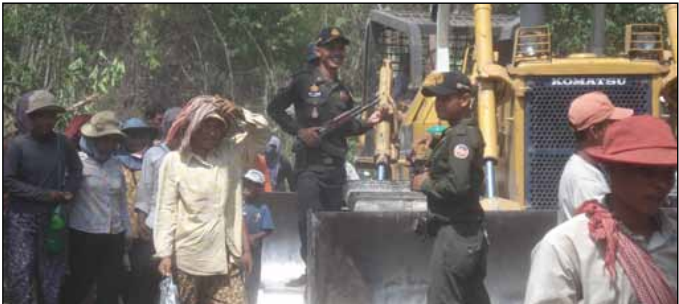
កងយោធពលខេមរភូមិន្ទ ការពារ គ្រឿងចក្រប៊ុលដូសើ របស់ក្រុមហ៊ុន ស៊ីហ្គីភីពេញ ខណៈពេលដែល ប្រជាជននៅឃុំអមលាំង ក្នុងខេត្តកំពង់ស្ពឺកំពុងព្យាយាមបញ្ឈប់ការឈូស ឆាយដី។

ករណីសិក្សាដែលបានលាតត្រដាងនៅក្នុងរបាយការណ៍ នេះ ផ្តល់នូវបង្អួចមួយទៅក្នុងជីវិតនៅពីក្រោយជំនឿ ដីធ្លីដែល កើតមានឡើងនៅក្នុងប្រទេសកម្ពុជា។ របាយការណ៍នេះផ្តល់ បច្ចុប្បន្នភាពមួយលើជម្លោះដីធ្លី និងភូមិ ដែលមានការប៉ះពាល់ ដោយសារបញ្ហានេះ និងធ្វើការព្យាយាមដោះស្រាយចំពោះ របស់ ប្រជាពលរដ្ឋ តួយ៉ាង ដូចជាលោកយាយ សាំង និងអ្នកដទៃ ទៀត- ដែលបានសួរខាងលើ ក៏ដូចជាសំណួរចម្លើយ “ថាតើនឹងមានអ្វី កើតឡើងបន្តទៅទៀត?” ។