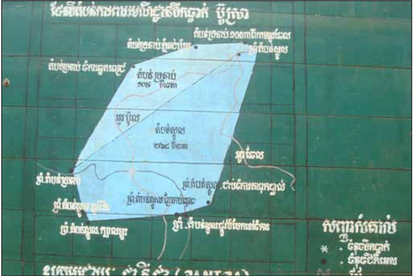
ផែនទីចង្អុលបង្ហាញតំបន់ការពាររបស់រាជរដ្ឋាភិបាលកម្ពុជា ប៊ូស្រា

ករណី: ឃុំប៊ូស្រា ស្រុកពេជ្រចិន្តា ខេត្តមណ្ឌលគីរី សម្បទាន: ផ្តល់រយៈពេល ៧០ឆ្នាំសម្រាប់ចំការដំណាំកៅស៊ូ កាលបរិច្ឆេទ និងទំហំ: ចំនួន ១០.០០០ហិកតា ផ្តល់នៅខែតុលា ឆ្នាំ២០០៨ ដោយក្រសួងកសិកម្ម រុក្ខាប្រមាញ់ និងនេសាទ ។ ក្រុមហ៊ុន: សហវិនិយោគរវាងក្រុមហ៊ុនបារាំងឈ្មោះសុកហ៊ុន (Socfin) និងក្រុមហ៊ុនខ្មែរឈ្មោះ វេស៊ីឌី (KCD) ។ គម្រោងអភិវឌ្ឍន៍: ចំការដំណាំកៅស៊ូដោយមានការស្នើសុំភ្នាក់ងារអភិវឌ្ឍន៍បារាំង (AFD) ដើម្បីគាំទ្រ ដល់ចំការដំណាំកៅស៊ូជាលក្ខណៈគ្រួសារនៅតំបន់ជិតខាង ។ - ខែឧសភា-ខែកញ្ញា ឆ្នាំ២០០៩: ក្រុមហ៊ុនបានដាំដើមកៅស៊ូ និងបន្តការឈូសឆាយដី ។ - ខែវិច្ឆិកា ឆ្នាំ២០០៩: អង្គការក្រៅរដ្ឋាភិបាលបានផ្តល់អនុសាសន៍ច្បាប់ដល់សហគមន៍ និងក្រុមហ៊ុន ។ - ខែមករា ឆ្នាំ២០១០: ក្រុមហ៊ុនសុកហ៊ុនបានបញ្ឈប់ការឈូសឆាយដីហើយស្នើសុំឱ្យមានកិច្ចប្រជុំជាមួយ រដ្ឋាភិបាល និងសហគមន៍ដើម្បីធ្វើការចរចាគ្នា ។