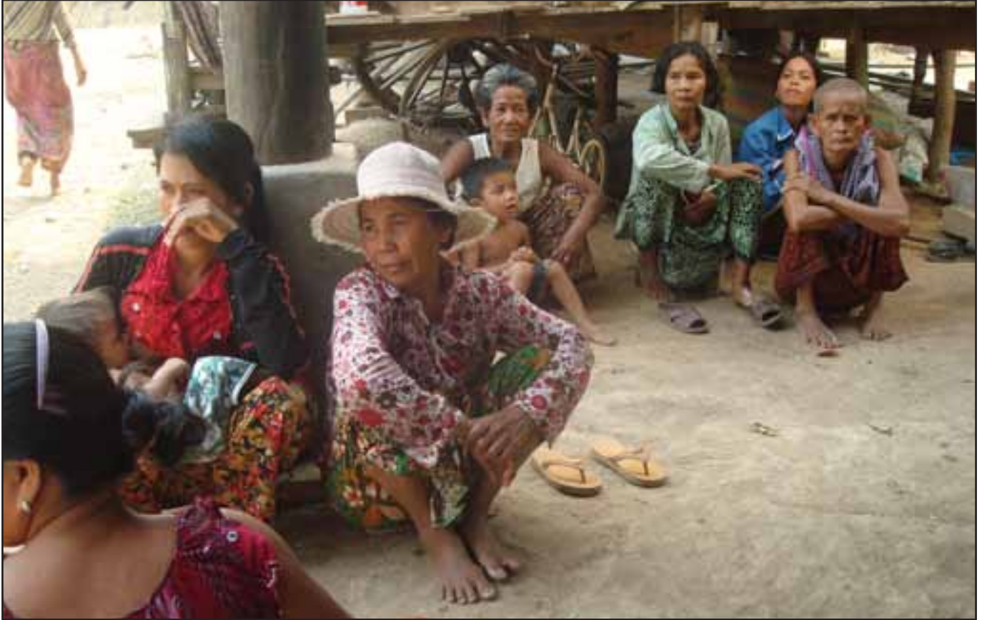
ប្រយុទ្ធប្រឆាំងទៅនឹងភាពភ័យក្លាចអាជ្ញាធរ ដែលដី ប្រជាជនបាននាំគ្នាប្រជុំស្នាក់ ដើម្បីពិភាក្សាពីស្ថានភាព ឪពុក ប្តី បង-ប្អូន ប្រុស របស់ពួកគាត់ដែលបានជាប់ពន្ធនាគារ និងរិះរកមធ្យោបាយដើម្បីឱ្យគេដោះលែងពួកគេមកវិញ។