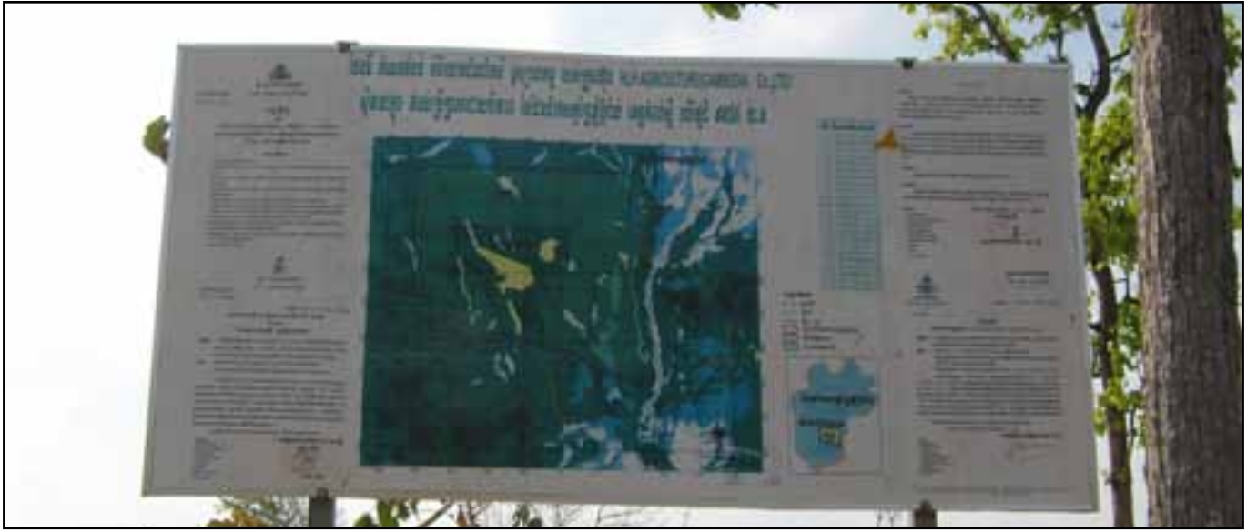
ផែនទីកំណត់តំបន់កសិឧស្សាហកម្មរបស់ក្រុមហ៊ុន អេច អិល អេច ដែលមានទីតាំងក្នុងតំបន់ ជីវកសិកម្មព្រៃភ្នំខ្ពស់ ខេត្តកំពង់ស្ពឺ ដែលមានផ្ទៃដីចំនួន ៩៩៨៥ ហិកតា។ ទំហំដី-នេះត្រូវបានផ្ទេរពីសម្បត្តិរដ្ឋ ទៅជាសម្បត្តិឯកជន មុនពេលប្រគល់អោយក្រុមហ៊ុន អេច អិល អេច (ច្បាប់ចម្លងនៃអនុក្រឹត្យមួយច្បាប់ក៏បានភ្ជាប់ជាមួយផងដែរនៅផ្នែកខាងឆ្វេងនៃផែនទី)

ការប្រមូលករណីសិក្សាចំនួន១១នេះ វាគ្រាន់តែជាការបង្ហាញនូវឧទាហរណ៍មួយចំនួន នៃជម្លោះដីធ្លីដ៏ខ្លាំងបំផុត ដែលកំពុងតែបានកើតមានពាសពេញប្រទេសកម្ពុជា ដែលបានបង្កឡើងដោយ " គំរោងអភិវឌ្ឍន៍ ឧស្សាហកម្ម " នៅក្នុងអំឡុងពេលជិត២ទសវត្សរ៍នេះ ។