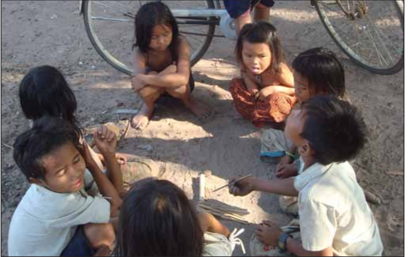
ពួកក្មេងៗនាំគ្នាលេងនៅក្បែរផ្ទះរបស់ពួកគេដោយពុំបានដឹងថា ពួកគេនឹកគ្មានដីសំរាប់ធ្វើស្រែចំការនៅពេលដែលពួកគេធំឡើង ដោយសារតែដីស្រែពីដូនតារបស់ពួកគេ ត្រូវបានក្រុមហ៊ុនកាន់កាប់ នៅឡើយទេ។