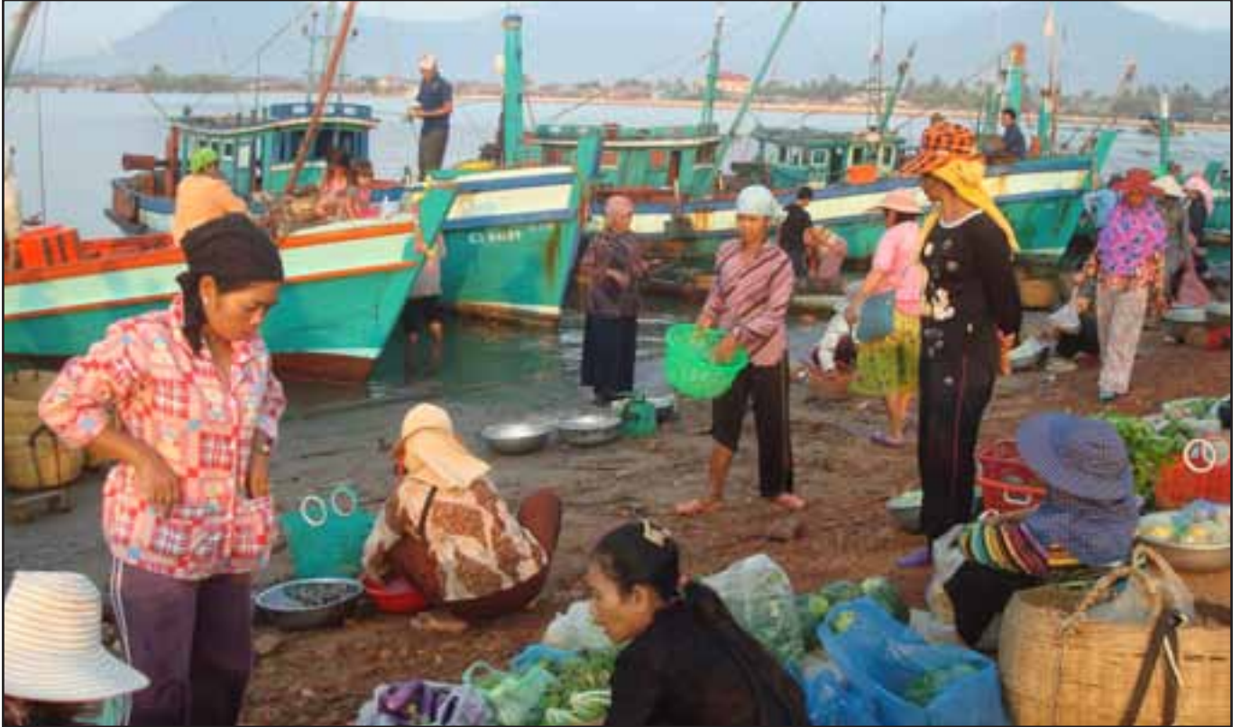
ក្រុមស្ត្រីអ្នកលក់ដូរ កំពុងតែមហាញ្ញក្នុងការលក់ត្រីរបស់ពួកគាត់ដែលចាប់បានក្នុងទឹកជ្រៅនៅឯសមុទ្រក្នុងខេត្តកំពត។ ដោយឡែកសំរាប់អ្នកដែលនេសាទនៅទីកន្លែងនឹងត្រូវបាត់បង់មុខរបរ របស់គាត់នៅពេលដែលក្រុមអ្នកអភិវឌ្ឍន៍ធ្វើការ ចាក់ដីលុបសមុទ្រនៅក្នុងស្រុកទឹកឈូ។