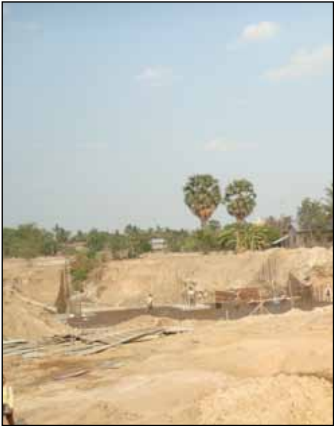
កម្មករកំពុងធ្វើការ នៅក្នុងការដ្ឋានគំរោងប្រឡាយទឹក ក្នុងឃុំឈើត្ដី។ ប្រឡាយធម្មជាតិ ដែលឆ្លាបមានហូរ នៅក្នុងឃុំ ត្រូវរលាយបាត់ជាមួយនឹងផ្ទះសំបែងរបស់អ្នកភូមិ។

នៅពេលដែលសួរថា តើពួកគាត់នឹងទទួលបានជោគជ័យដែរ ឬទេ ? ពួកគាត់ឆ្លើយតបដោយគ្រវីក្បាល ព្រមទាំងថា “ពួកយើងពុំមានក្ដី សង្ឃឹមណាមួយឡើយថា ពួកគេនឹងសងការខូចខាតដល់ពួកយើងនោះ ” ។