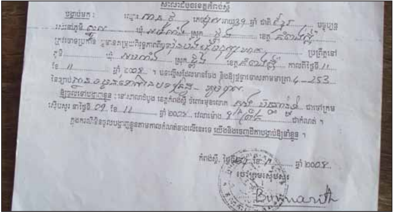
ដីការរបស់តុលាការខេត្តកំពង់ស្ពឺ កោះហៅលោក សាន ថូ ឱ្យចូលបង្ហាញខ្លួនដើម្បីផ្តល់ចំណើយ ក្នុងបទប្តឹងបង មនុស្សឃាត ដោយសារតែលោកបាន ដឹកនាំប្រជាជនទៅធ្វើការ តវ៉ាប្រឆាំងនឹងការដណ្តើមយកដីរបស់ក្រុមហ៊ុន។