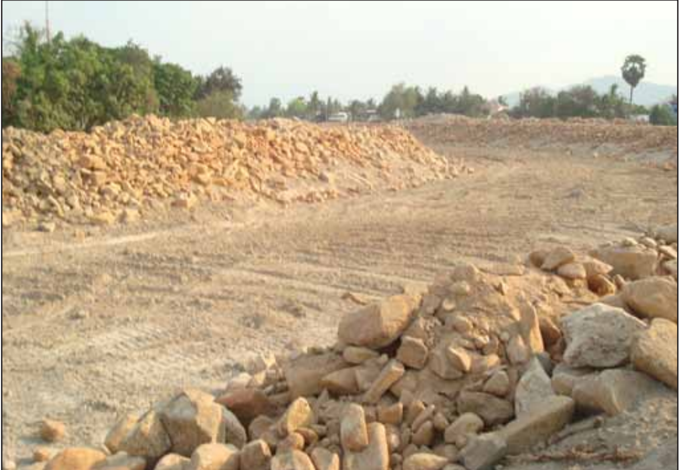
ទីតាំងសំណង់ប្រឡាយទឹកចាប់ផ្តើមនៅក្នុង ឃុំឈើត្តិ ដែលជាឃុំមួយក្នុងចំណោមឃុំ ដែលទទួលរងនូវផលប៉ះពាល់ដោយគំរោងនេះ ដែលធ្វើឡើងនៅក្នុងខេត្តកំពង់ឆ្នាំង និងពោធិសាត់