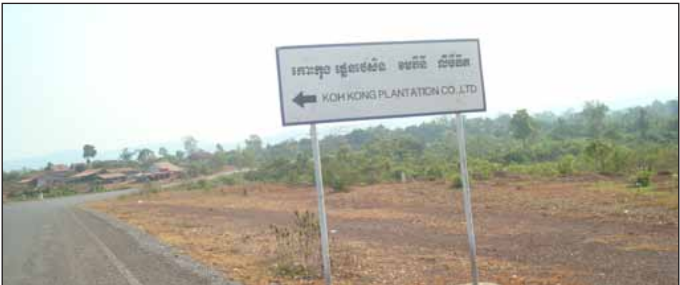
ផ្លូវបង្ហាញទិសដៅទៅកាន់ទីតាំងក្រុមហ៊ុន ចំការដំណាំ កោះកុង ដែលត្រូវបានគេដាក់នៅលើចិញ្ចឹមផ្លូវហាយវេថ្មីឆ្ពោះទៅកាន់ខេត្តកោះកុង