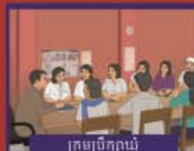
ក្រុមប្រឹក្សាឃុំ