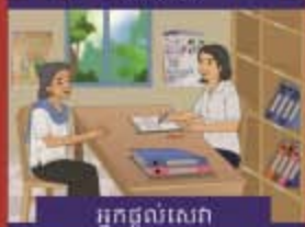
អ្នកផ្តល់សេវា